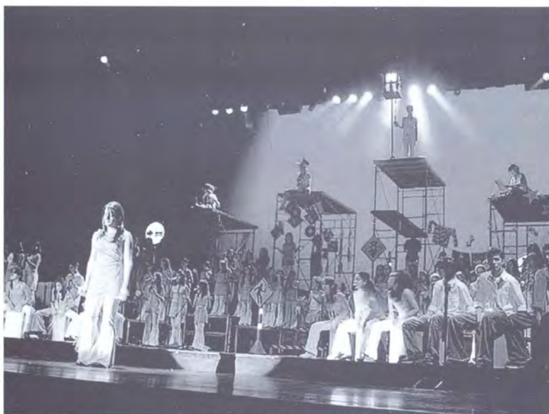
CONCIERTO DE NAVIDAD CORO INFANTIL CANTO ALEGRE Y PRESENCIA Colombo Suiza

Al terminar el concierto cada niño, niña y joven reflejaba en su cara la esperanza de vivir una navidad plena de paz y amor con sus familias.