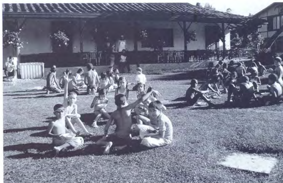
FINCA EL JARDÍN

Tenemos espacios deportivos como canchas de fútbol, voleibol, tenis de mesa, billar y piscina.