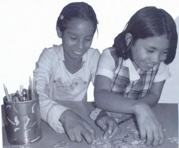
NIÑAS DEL BARRIO LIMONAR