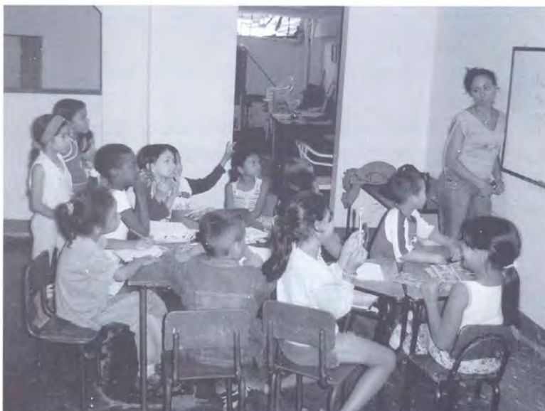
NIÑOS PROGRAMA DE INGLÉS DEL BARRIO LA IGUANÁ