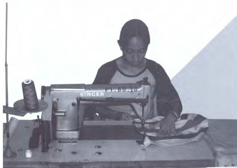
CAPACITACIÓN EN CONFECCIÓN CCJ BARRIO ANTIOQUIA