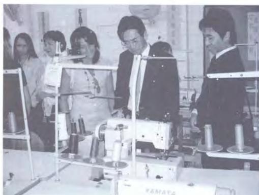
SEÑOR WATARU HAYASHI EMBAJADOR DE JAPÓN EN COLOMBIA HACIENDO ENTREGA DE LAS MÁQUINAS

La Embajada de Japón en Colombia donó 28 máquinas especializadas de confección, para fortalecer el Centro de Capacitación Juvenil de Robledo, por un valor de $79.500, teniendo en cuenta las necesidades de jóvenes y la demanda del mercado laboral.