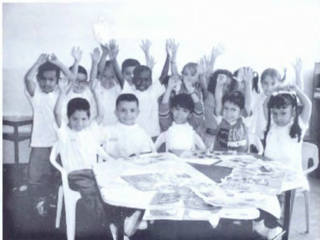
NIÑOS DEL JARDÍN INFANTIL "LA ALEGRIA DE SER" DEL BARRIO EL LIMONAR