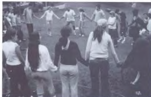
TALLER DE FORMACIÓN VOCACIONAL, DEL PROYECTO BELLOTA

Esta es una propuesta educativa complementaria a la educación formal, dirigida a los niños, niñas y jóvenes con menos recursos, que merecen iguales oportunidades de formación, que necesitan mayor acompañamiento en su elección de vida y que les brinde opciones laborales más estables.