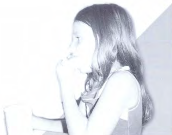
NIÑA BENEFICIARIA DEL PROGRAMA RESTAURANTES ESCOLARES

* Implementar procesos de capacitación en el área de la nutrición.