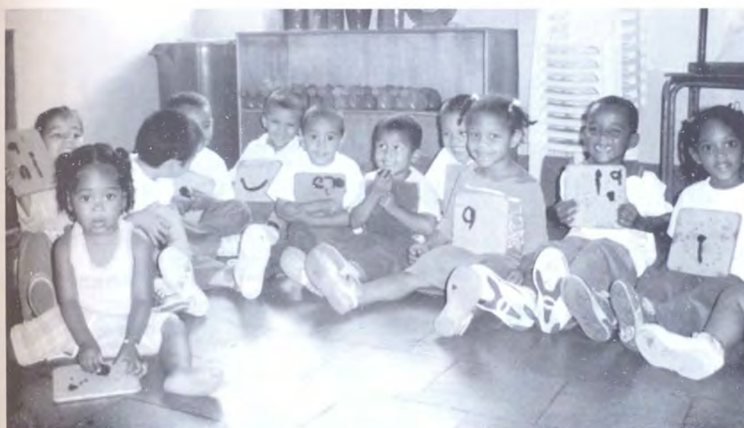
JARDÍN INFANTIL "LA ALEGRÍA DE SER"