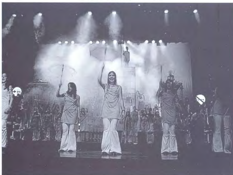
CONCIERTO DE NAVIDAD CORO INFANTIL CANTO ALEGRE Y PRESENCIA Colombo Suiza