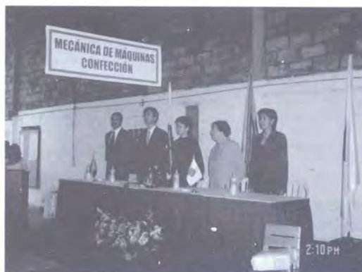
INAGURACIÓN DEL SALÓN DE MÁQUINAS ESPECIALIZADAS DE CONFECCIÓN