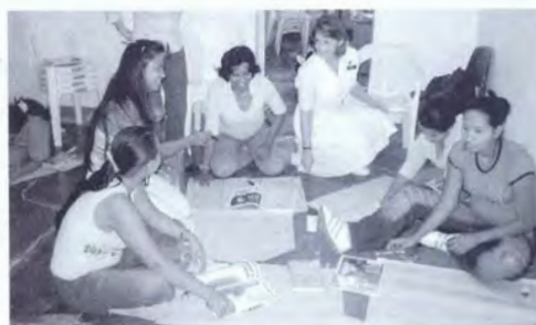
TALLER CON MADRES DEL BARRIO LA IGUANÁ