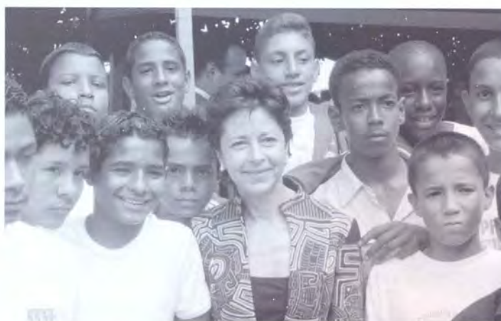
SEÑORA LINA MORENO DE URIBE, CON LOS JOVENES DEL CENTRO DE CAPACITACIÓN JUVENIL DE ROBLEDO